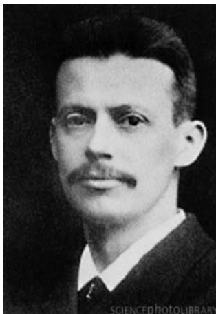
Рис. 2. Н.-Р. Финсен – основатель фотодинамической терапии

Хотя концентрация фотосенсибилизатора в нормальных тканях низкая, в течение нескольких недель может наблюдаться их повышенная чувствительность к солнечному свету.