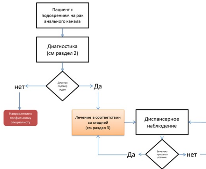
Схема 1. Блок-схема диагностики и лечения больного плоскоклеточным раком анального канала